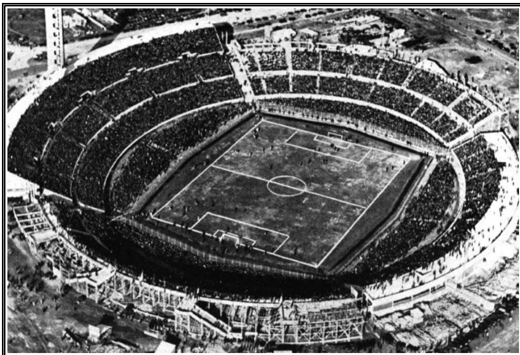
Vue aérienne du stade Centenario, Montevideo, 18 juillet 1930

Enjeux, acteurs et temporalité d'un événement global (XXe-XXIe siècles)