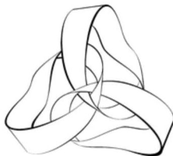
Figure 1. Entrelacements entre des rubans de Möbius

Étant donné que chaque circuit est comme un ruban de Möbius, prêt à renverser ces côtés, l'entrelacement ne se réalise pas nécessairement là où on trouve une face du circuit qui a déjà joué le rôle de côté externe. Les entrelacements sont alors récurrents mais mobiles, chaque renversement inattendu donnant lieu à une perturbation qui demande un nouvel équilibre du circuit concerné (voir figure 1).