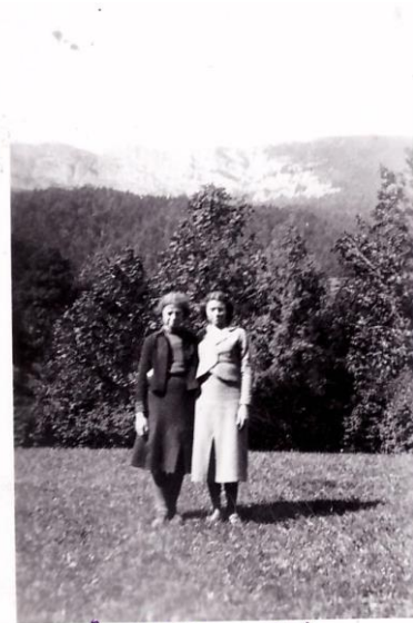
La Ferrière 1938