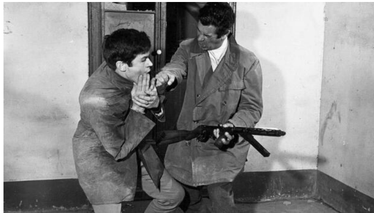
Figura 6. Los atracadores de A tiro limpio matándose entre ellos.