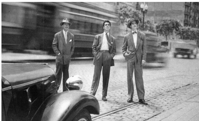
Figura 1. La ciudad siempre es el telón de fondo. Ignacio F. Iquino, Brigada criminal (1950).

Soy de la opinión de que la sintonía entre el cine y el cómic es mucho mayor que la habida entre el cine y el teatro. En los comienzos de la pantalla, los primeros realizadores se limitaban a colocar el trípode con la cámara frente a un escenario. Después dejaban que los actores evolucionasen delante del objetivo. El cine no descubrió su lenguaje hasta que no partió con esa tendencia a imitar al teatro y empezó a articular su narración en planos. Y en planos, en viñetas, organiza sus historietas el cómic.