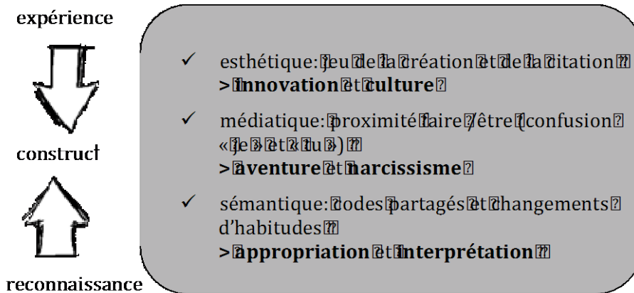
Figure 1. Stratégie du designer d'interaction

On relève dans l'application Lost Untold que le designer propose dans le cadre de la conformité :