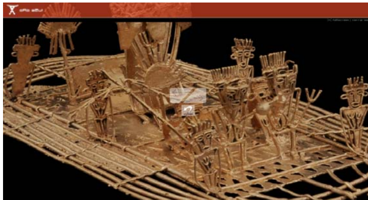
Figure 3. Capture d'écran interface de visualisation d'Oro Azul

L'interface de visualisation de la plateforme Oro Azul 11 (figure 3) comporte une scénarisation beaucoup plus simple que celle qu'on vient de voir. Sa fonction principale est également l'observation de l'objet d'art. Les informations métatextuelles à propos de l'œuvre se retrouvent sur la page précédente. En conséquence, le niveau d'interaction de cette page avec la totalité de l'hypertexte est assez faible. Pour accéder à d'autres fonctionnalités, l'utilisateur doit activer la commande volver au centre de l'écran. Libérée pour ainsi dire d'autres fonctionnalités et des contraintes discursives, cette interface accentue l'interaction entre