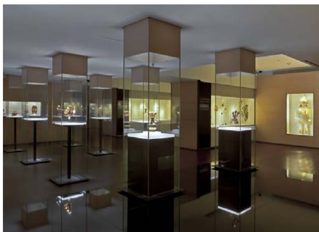
Figure 1. Salle "El trabajo de los metales" Museo del Oro. Bogotá 8

La figure 1 présente une salle du Musée de l'or où sont exposés des objets d'art précolombien, dont certains sont visibles grâce aux interfaces en question. Cette image permet de se faire une idée globale de la scénarisation, ou de la mise en exposition de l'objet d'art, et de la pratique muséale à laquelle participe le public.