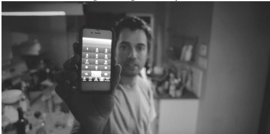
Figure 1. Image tirée de l'épisode 1 de la websérie Émilie .

Le scénario de la websérie Émilie est pensé pour intégrer des moments de communication entre les personnages de fiction et le spectateur. D'ailleurs, la lecture s'arrête si ce dernier ne réagit pas à ce que le contenu interfacé lui propose. Tel qu'illustré à la figure 1, un personnage de la websérie invite le spectateur à inscrire ses coordonnées téléphoniques dans l'image du téléphone mobile présenté à l'écran. Le visionnement demande donc l'accès à un appareil connecté, muni d'un clavier. En peu de temps, le spectateur reçoit un appel (préenregistré) d' Émilie , le personnage principal de l'intrigue. L'interaction suscitée donne l'illusion d'impliquer le spectateur dans le dispositif diégétique , en le faisant entrer dans l'univers fictionnel, mais également en brouillant les frontières entre la fiction et la réalité. Comment un personnage de