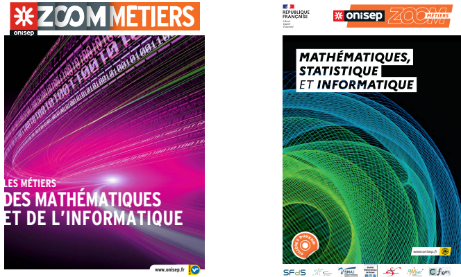
FIGURE 4. Brochure Zoom métiers, éditions 2015 et 2021

5.4. Communication. Pour maintenir les liens au sein de la communauté entre les divers évènements organisés au cours de l'année, la CFEM réalise un Bulletin qui était mensuel sous la présidence de Luc Trouche et est devenu bisannuel 13 , complété par une lettre d'information mensuelle.