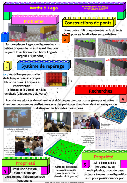
FIGURE 1. Poster réalisé en atelier MATH.en.JEANS

leurs résultats en les soumettant à la critique des autres équipes lors de tournois régionaux (voir les détails sur le site https://tfjm.org/ ). Les meilleures équipes participent au Tournoi national, et la meilleure ou les deux meilleures à l'International Tournament of Young Mathematicians (ITYM). Une version à distance du TFJM 2 , les Correspondances mathématiques, a été lancée en 2018.