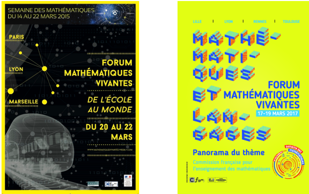
FIGURE 1. Affiche du 1er Forum Mathématiques Vivantes 2015. Brochure Panorama du thème Mathématiques et langages du Forum Mathématiques Vivantes 2017