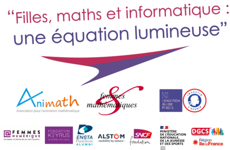
FIGURE 3. Annonce d'une journée “filles, maths et informatique : une équation lumineuse”

Plus les études comportent de maths ou d'informatique, moins il y a de filles. Nous sommes convaincus que ce n'est pas une histoire de cerveau. Et nous mettons en avant trois raisons principales : l'omniprésence des stéréotypes sociaux de sexe, le manque de modèles d'identification et la méconnaissance des métiers vers lesquels débouchent ces études. Ces journées ont donc pour objectifs d'amener les participantes à repérer les stéréotypes sociaux de sexe pour tenter de s'en affranchir, découvrir des modèles d'identification accessibles, mieux connaître les métiers des mathématiques, de l'informatique et le secteur du numérique. Elles s'adressent aux filles, de la troisième à la