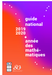
FIGURE 2. Le guide national préparé par le Ministère

5.2. Participation à l'Année des mathématiques. En partenariat avec le CNRS (centre national de la recherche scientifique, (pour ses 80 ans), le ministère de l'Éducation nationale et de la Jeunesse a lancé l'Année des mathématiques le 2 octobre 2019 9 . Elle avait pour ambition de montrer au grand public le visage vivant des mathématiques et de renforcer le lien entre le monde de la recherche et les enseignants du secondaire 10 . La CFEM a été invitée au comité de pilotage de cette Année des mathématiques qui devait être ponctuée d'événements phares et de rencontres sur l'ensemble du territoire, impliquant de nombreux partenaires associatifs, et des actions de formation pour les