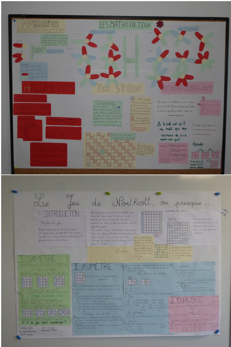
FIGURE 2. Posters réalisés lors de stages Hippocampe