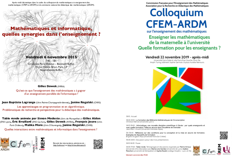
FIGURE 3. Affiches du Colloquium CFEM-ARDM (années 2015 et 2019)

enseignants, en lien avec les mesures du plan Villani-Torossian, mis en œuvre par la Mission Mathématique 11 . Le dernier évènement clôturant l'Année devait être la participation de la France au congrès ICME-14. La pandémie de Covid 19 a bouleversé l'organisation, et le Grand forum des mathématiques vivantes (GFMV), prévu à Lyon du 13 au 16 mai 2020, a été reporté et transformé en une manifestation plus modeste et à distance 12 . La CFEM a participé activement à la réalisation du guide national de l'Année [75] et au comité et à l'organisation scientifique du GFMV.